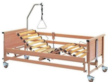
Elektrické polohovací lůžko Dali