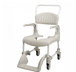
Sprchové toaletní křeslo Etac