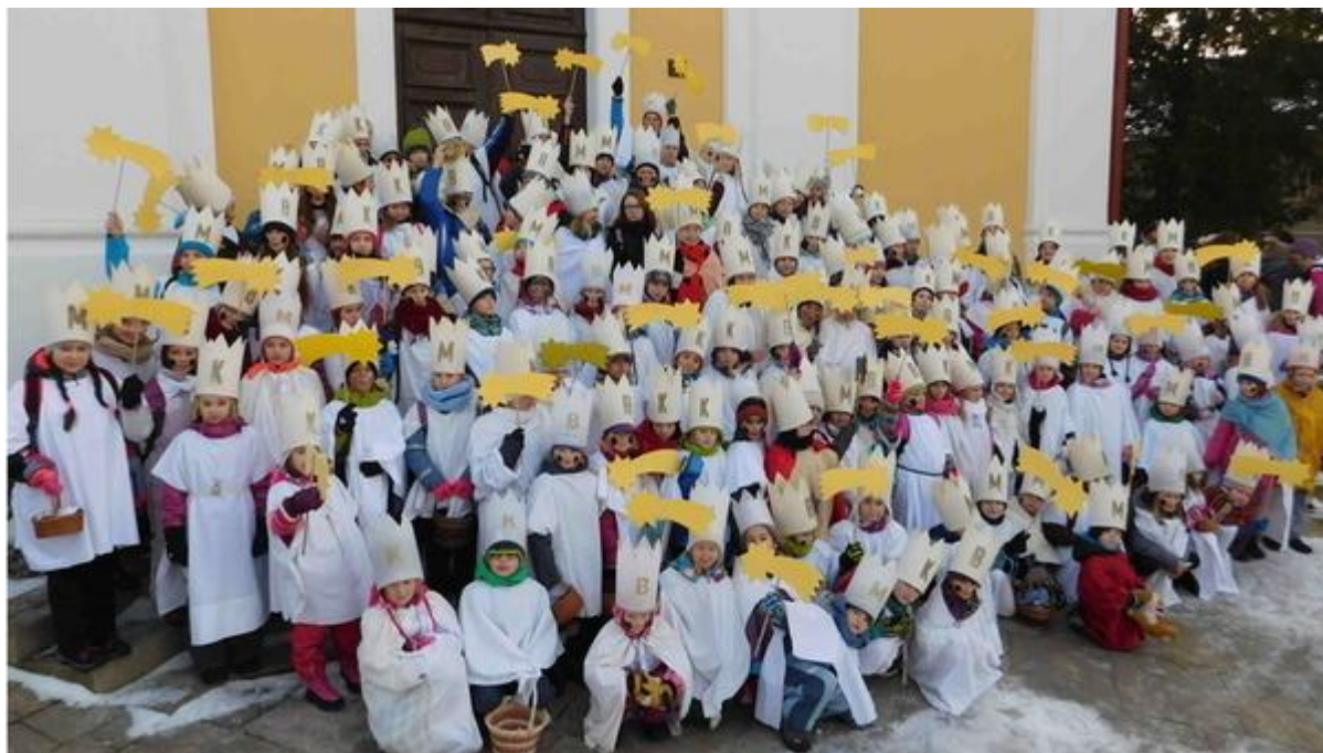
Koledníci z Dobrušky po požehnání, focení před kostelem sv. Václava

Tříkrálová sbírka v Dobrušce má za sebou mimořádný ročník. Nejen, že byl pro místní Farní charitu jubilejním patnáctým, ale také výtěžek si zasloužil obdiv – poprvé v historii zde překročil magickou půlmiliónovou hranici, neboť králové vykoledovali celkem 532 847 korun.