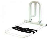
madlo k posteli