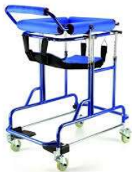
vysoké chodítko s podpůrnou deskou