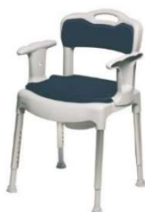
toaletní a sprchová židle