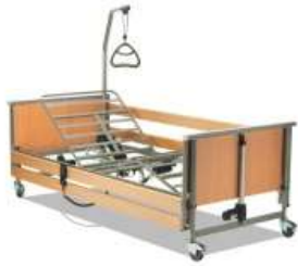
elektrická polohovací postel