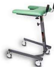
vysoké chodítko Stabilo